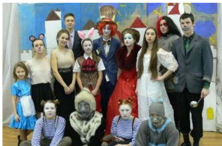
Костюмированный бал старшеклассников «Алиса в стране чудес»