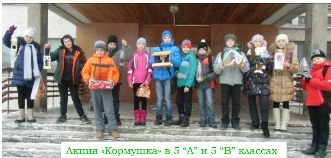
Акция «Кормушка» в 5 «А» и 5 «В» классах