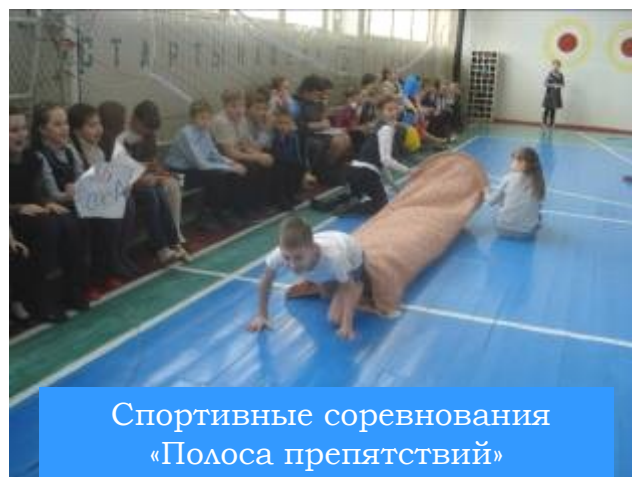
Спортивные соревнования «Полоса препятствий»